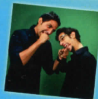
Matrangola e Minafò